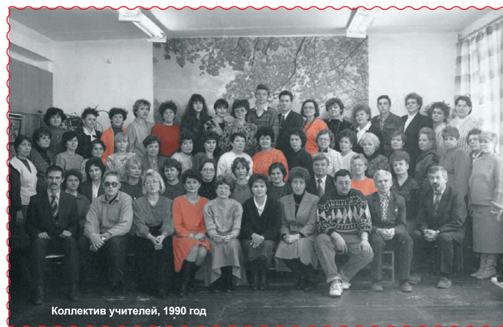
Коллектив учителей, 1990 год